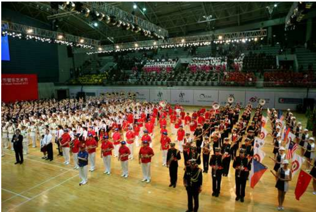
Cérémonie d'ouverture 2013

Le « Shanghai Spring International Band Music Festival » vise à promouvoir, développer et populariser la musique pour orchestres à vent. Le festival souhaite donc devenir une véritable vitrine culturelle internationale, permettant à de nombreux orchestres nationaux et étrangers de se produire sur différentes scènes de la ville.