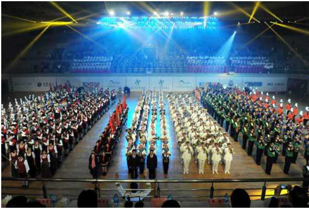
Cérémonie de clôture 2013

Se sont produits lors de la cérémonie de clôture 2013 : La fanfare de Washington Husky University de Seattle (USA), Musikverein Rühle (Allemagne), Cheb Brass Band (République Tchèque), l'orchestre de l'Université de Hanyang (Chine), Taipei YuchFu Drum and Bugle Corps (Taïwan), l'Orchestre Militaire de l'Armée de Libération du peuple chinois (Chine), l'Orchestre de l'Université Polytechnique de Pékin (Chine).