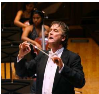
Johan de Meij

L'édition 2013 du festival a attiré 60 orchestres chinois et étrangers (plus de 3500 musiciens) qui se sont produits lors des cérémonies d'ouverture et de clôture du festival et lors de la grande parade des « Marching Bands » au bord de la rivière Huangpu. A l'occasion du concert de gala, Johan de Meij, compositeur et chef d'orchestre de renommée internationale, a dirigé l'orchestre à vent de l'armée chinoise à l'« Oriental Art Center ».