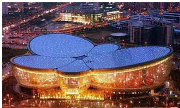
Oriental Art Center